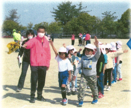
交通安全教室の様子 桜ヶ丘小ホームページ「桜まほろば日記」をご覧ください

登下校の安全を確保するため、PTA 地区委員の皆様、可児市交通安全女性の方、桜ヶ丘青少年育成会議の方、民生委員さん、地域の皆様、保護者様、可児警察署の協力を依頼し、子どもたちの登下校を見守っていただいております。ありがとうございます。5月、慣れてくるころに交通事故が増えると聞いておりますので、ご家庭でも交通安全についてぜひ話題にしてください。